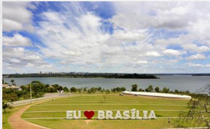
Ermida Dom Bosco