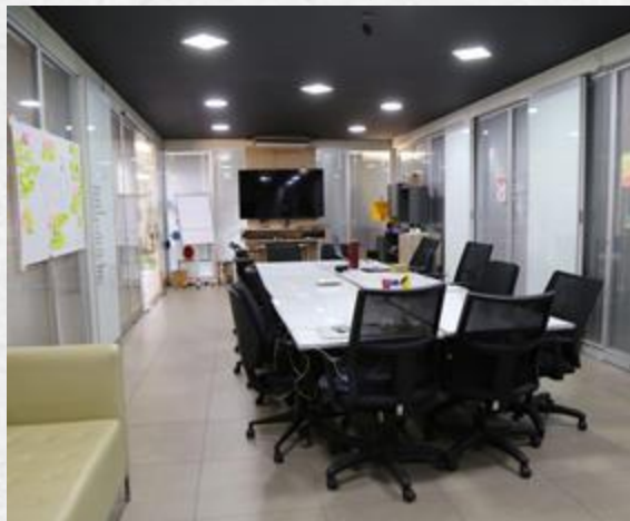
Laboratório de Inovação - GNova