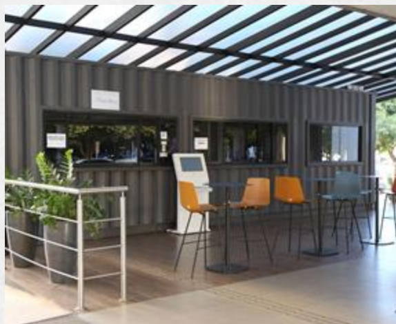
Restaurante e lanchonete