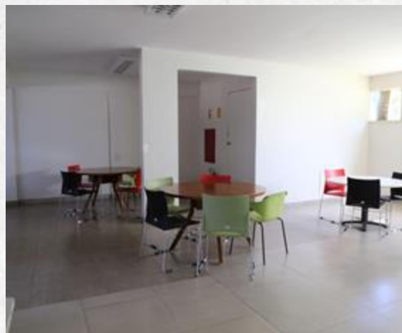
Sala de convivência