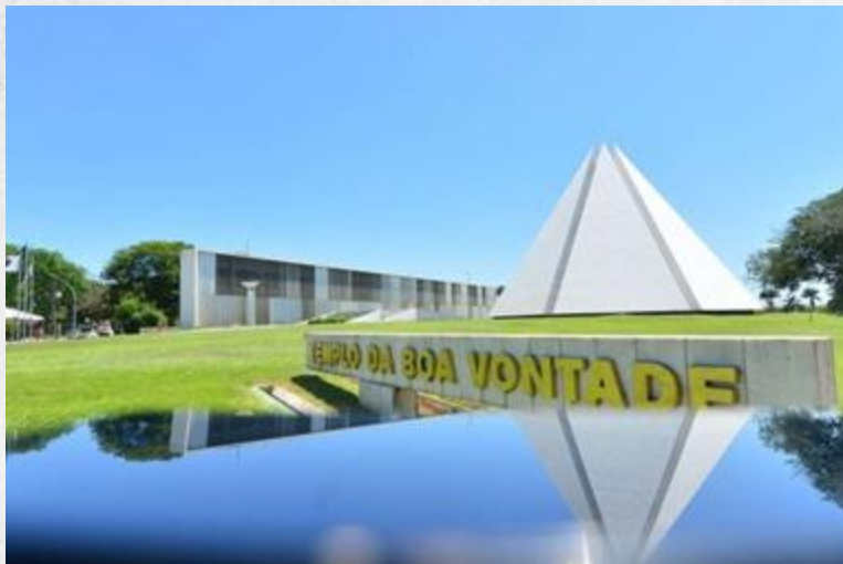
Templo da Boa Vontade