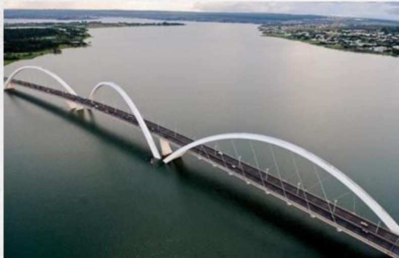
Ponte Juscelino Kubitschek