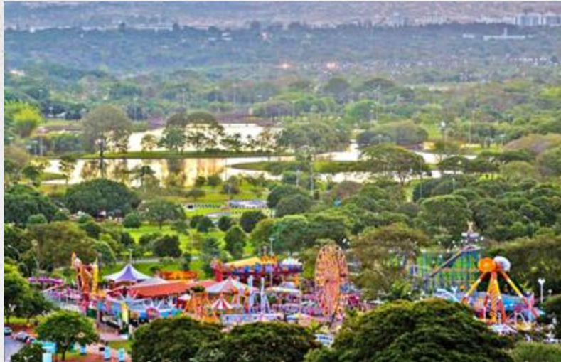
Parque da Cidade Sarah Kubitschek