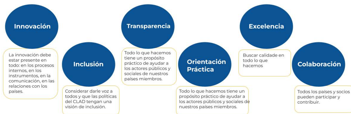
Ilustración 3. Elementos de la Planificación estratégica 2024-2026