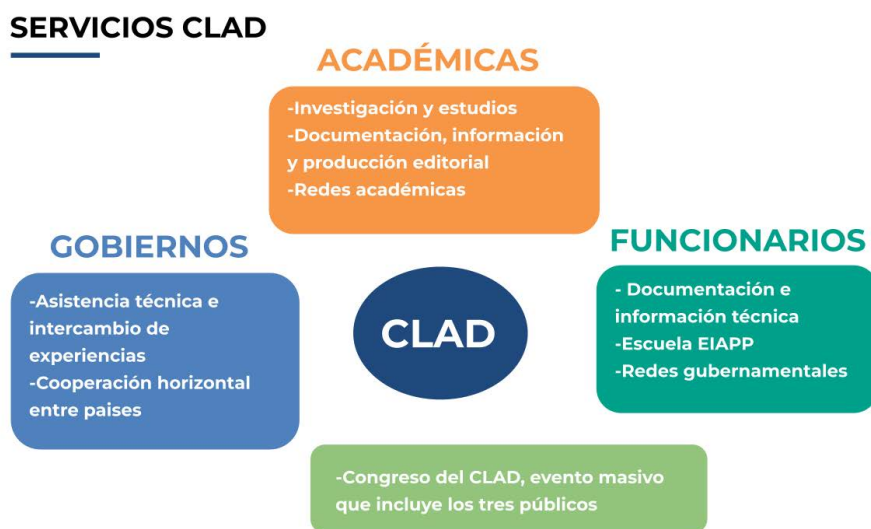
Ilustración 2. Servicios CLAD

Se puede sintetizar y agrupar los servicios como un todo en el siguiente esquema: