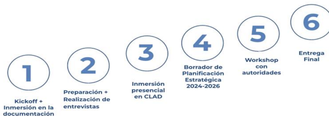
Ilustración 1. Etapas del proyecto

CLAD | Planificación Estratégica 2024-2026