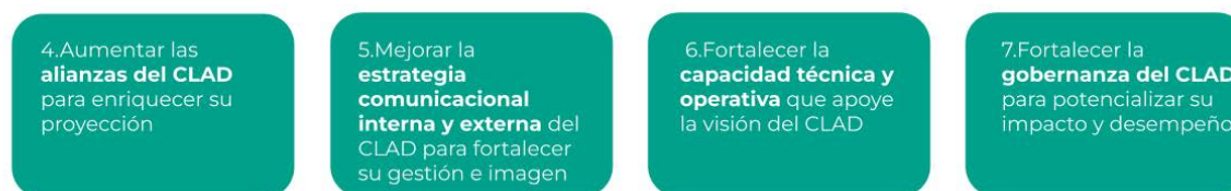
Ilustración 4. Objetivos estratégicos